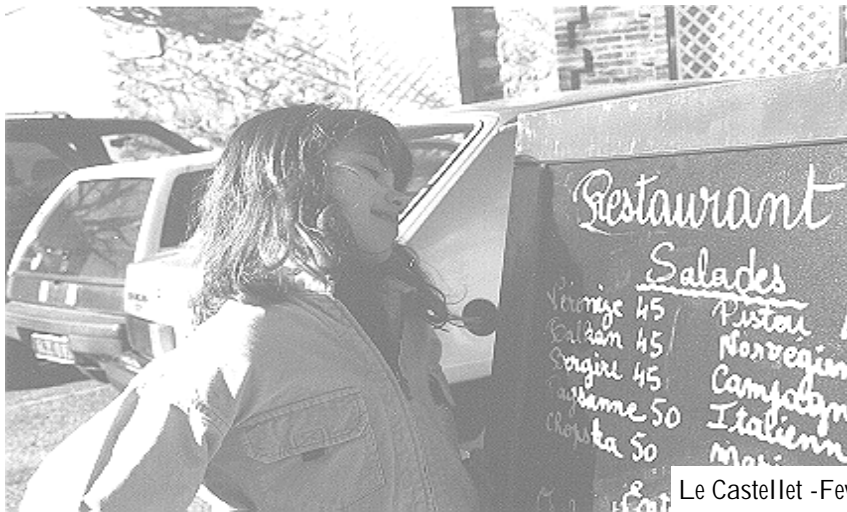
Le Castelllet - Fev 2001

* - 100 KF Déficit & 200 KF de roulement